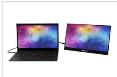
Monitor con laptop