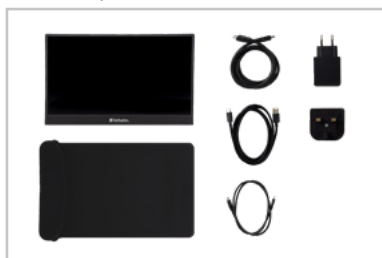
Contenido del paquete