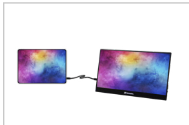
Monitor con tablet