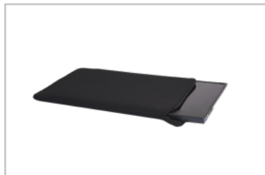
Funda de neopreno