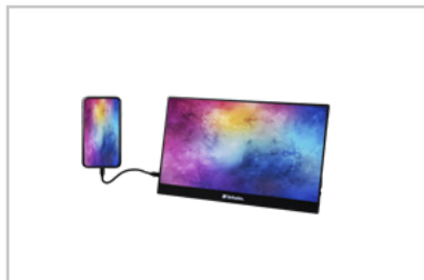
Monitor con smartphone